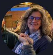
ASSISTANTE DE DIRECTION